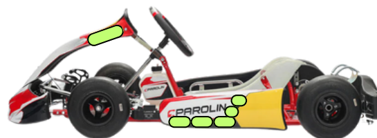
Vue de côté